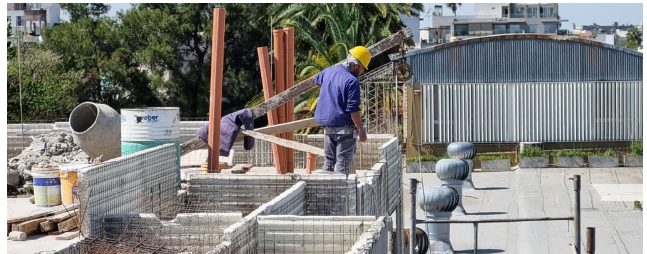
Alvear 1050 - Complejo Residencial Eco Sustentable