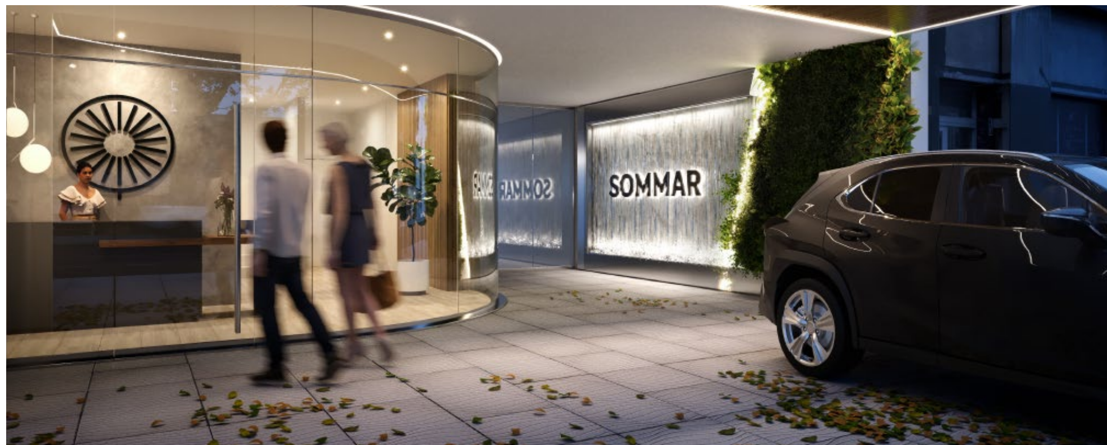
Sommar - Edificio de 7 pisos en Buenos Aires, Argentina