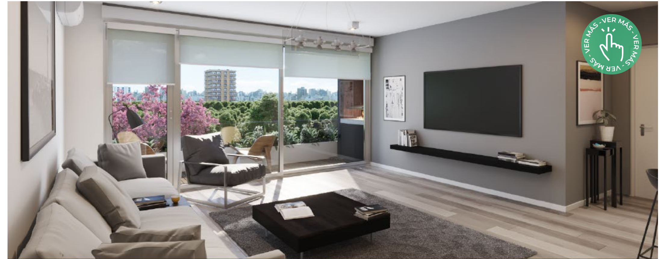
Complejo: Alvear 1050 - Proyecto, Dirección de Obra, Domótica

Nos dedicamos a encontrar soluciones integrales y respuestas concretas a los desafíos planteados, otorgando siempre a la visión del cliente un rol protagónico en las decisiones creativas.