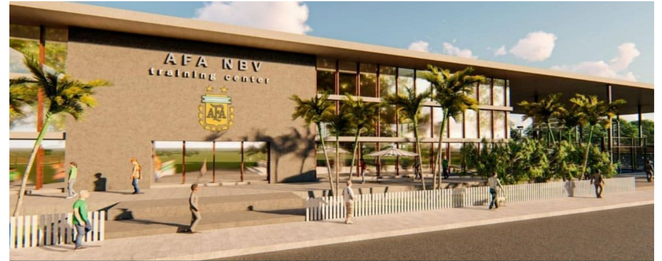
Predio AFA en Miami, USA - Documentación técnica, Asesoramiento