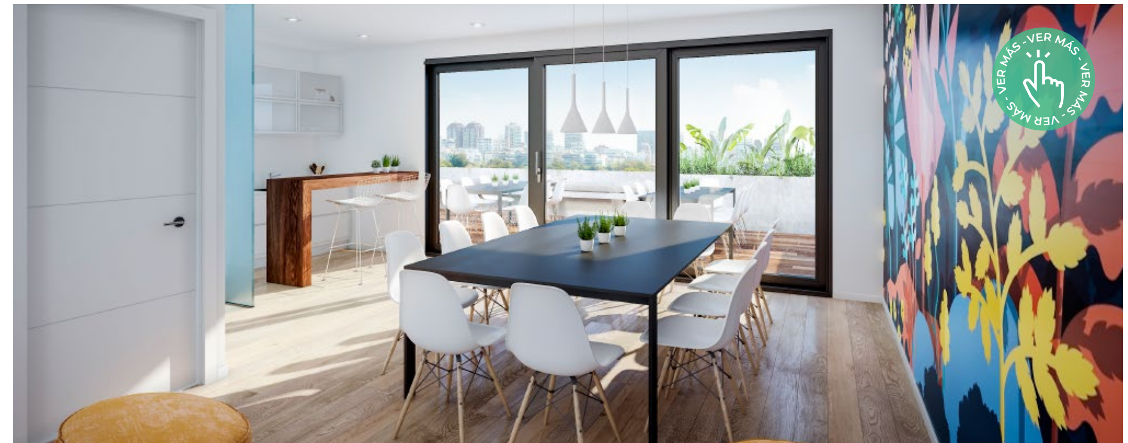
Edificio: Allegra EcoSmart - Proyecto, Dirección de Obra