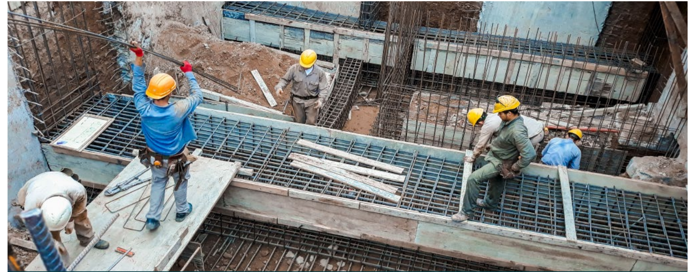
Allegra - Edificio de 9 pisos Eco Sustentable

La dirección de obra es esencial para garantizar que el proyecto se ejecute según lo planeado. Supervisamos cada fase de la construcción de manera periódica, estableciendo plazos, cronogramas de pagos y avances de obras de los trabajos conjuntos para que la construcción se desarrolle en tiempo y forma.