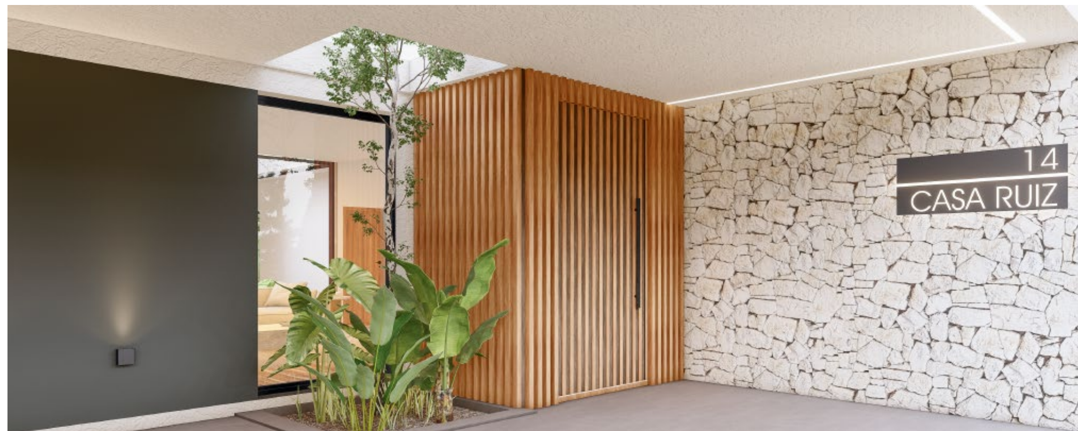
Casas Country: Nativo - Proyecto, Renders, Documentación Técnica