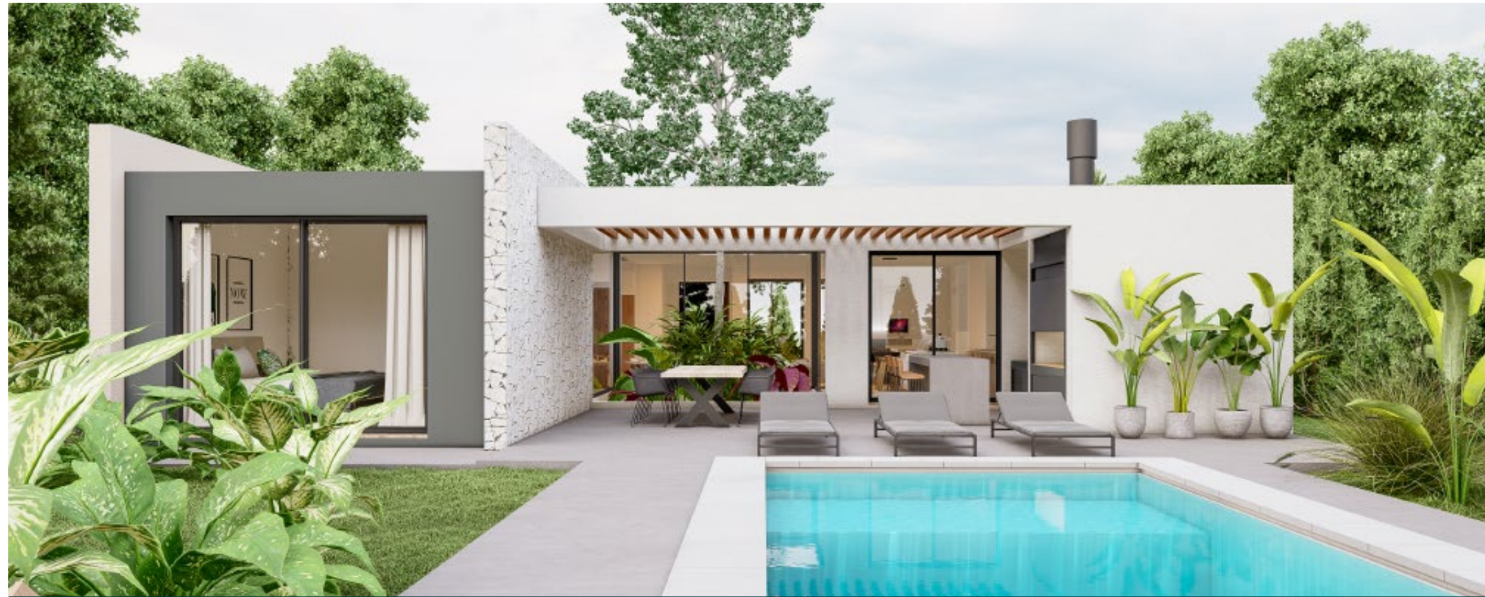
Nativo - Casas Country en Buenos Aires, Argentina