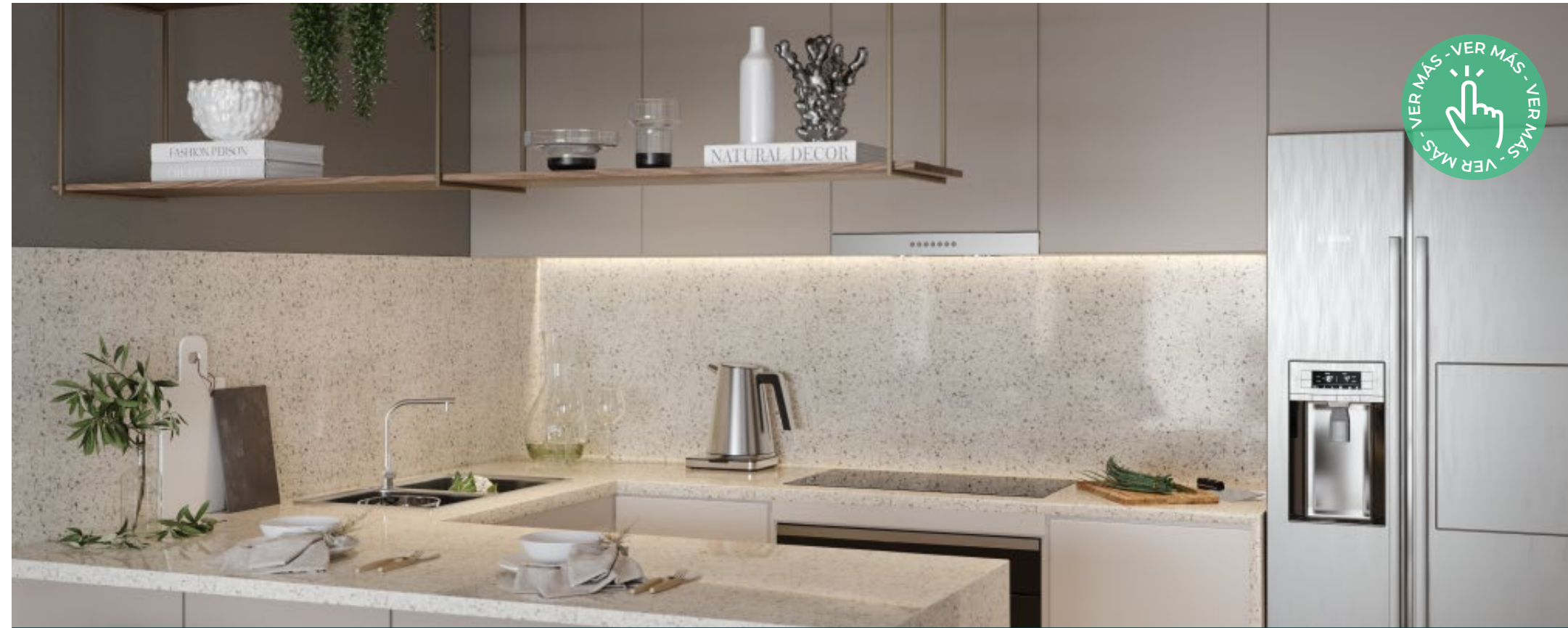
Edificio: Sommar - Proyecto, Documentación, Renders